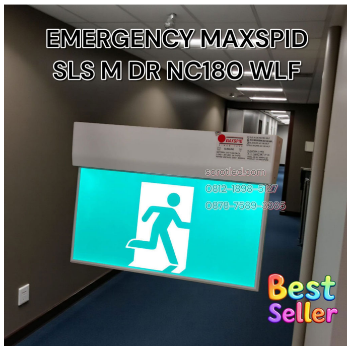
Lampu Exit MAXSPID SLS M DR NC180 WLF